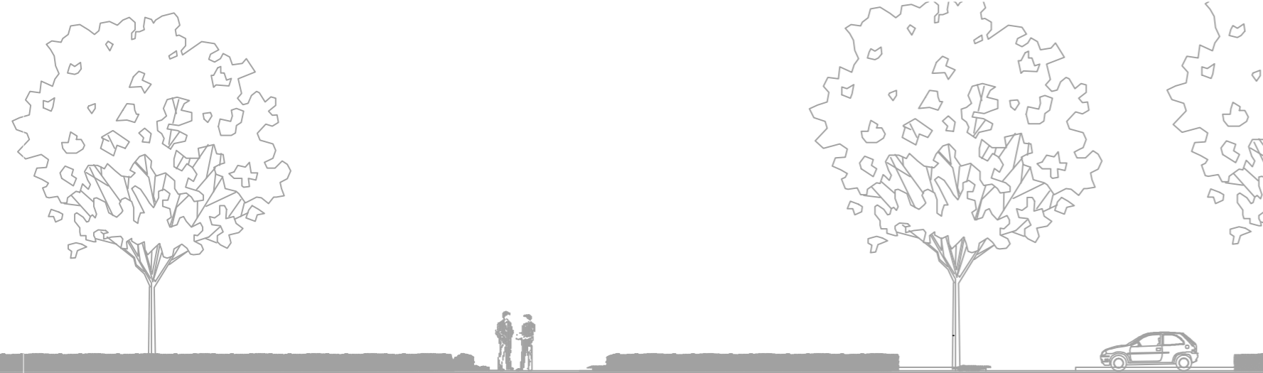
Przekrój podłużny ulicy od strony zachodniej