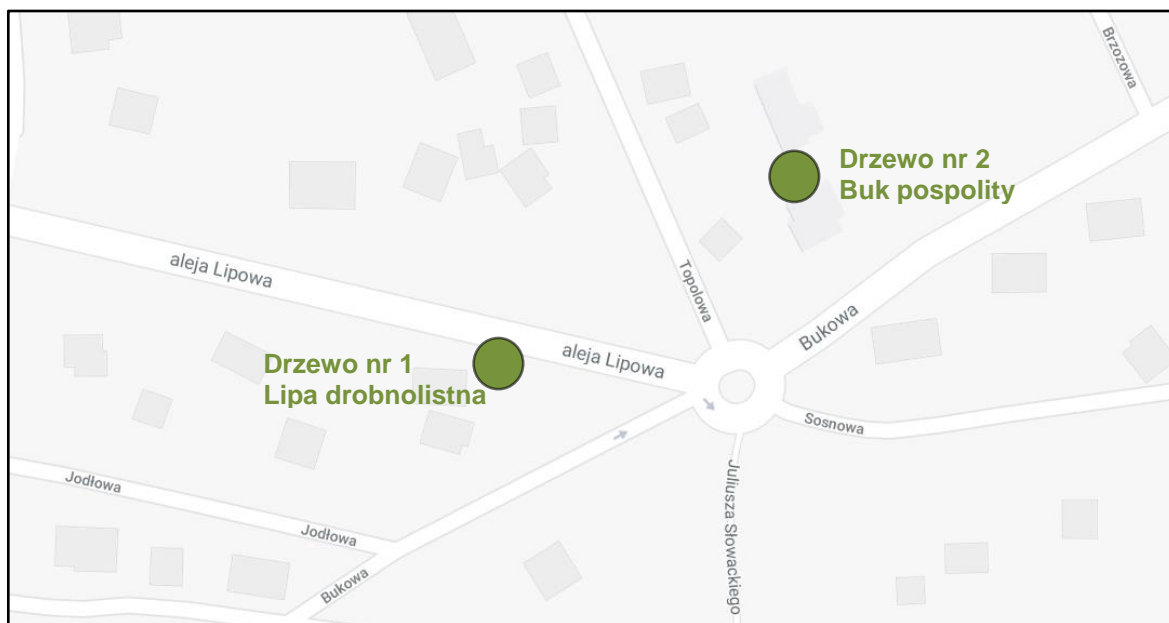
Ryc. 1. Lokalizacja drzew stanowiących przedmiot ekspertyzy w terenie

Przedmiot ekspertyzy stanowią 2 drzewa rosnące w Podkowie Leśnej wpisane do rejestru pomników przyrody: lipa drobnolistna ( Tilia cordata ) wchodząca w skład alei lipowej oraz buk pospolity odm. purpurowa ( Fagus sylvatica Purpurea ). Celem niniejszej ekspertyzy jest ocena stanu przedmiotowych drzew, pod kątem ich ewentualnego zagrożenia dla otoczenia.