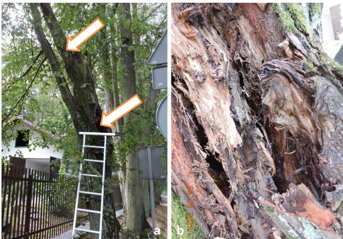
Ryc.3 – lipa rosnąca w zabytkowej alei.(a) strzałka dolna wskazuje miejsce zlokalizowania ubytku w pniu po wyłamaniu w przeszłości konarze. Górny kikut po drugim wyłamaniu konarze powyżej. (b) wypróchnienie w ubytku po zdjęciu wierzchniej warstwy korka.

z niewiadomych przyczyn uległ wyłamaniu. Powstała rana z czasem przekształciła się w ubytek wgłębny. W chwili oględzin, na powierzchni ubytku zalegała korowina, po zdjęciu której uwidoczniło się potężne wypróchnienie pnia wypełnione próchnem. Jak wykazało sądowanie ubytku, jego komora sięga na głębokość ca 90cm i w najszerszym miejscu, czyli na wysokości 260 cm nad poziomem gruntu miała średnicę 44 cm. Średnica pnia w tym miejscu wynosiła 53cm. Ściany komory miały grubość w tym miejscu od 4 – 5cm. W ubytku zalegało suche próchno (ryc. 3b).