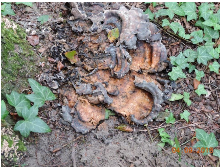
Ryc.5 – zaschnięte owocniki huby u podstawy pnia buka.

Wschodnia część korony w chwili oględzin była całkowicie martwa, natomiast część zachodnia wykazywała jeszcze żywotność. Ze stanu ulistnienia na części zachodniej korony wynika, że drzewo weszło już w stadium kladoptozy, czyli obumierania. Część liści w trakcie trwającego okresu wegetacji obumarła, pozostając na pędach. Pozostałe żywe liście posiadały stosunkowo niewielkie blaszki.