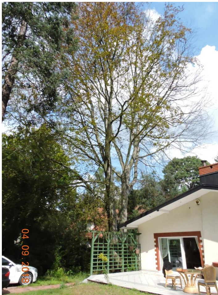
Ryc. 4. Buk pospolity odm. purpurowa, widok od strony południowo-zachodniej.

Buk jest wpisany do rejestru pomników przyrody pod numerem 1155 i rośnie na posesji prywatnej, przy ul. Bukowej 38 w Podkowie Leśnej. Drzewo rośnie przy północnej granicy posesji, w odległości 1,5m od ściany budynku mieszkalnego. Od strony południowej, bezpośrednio przy pniu istnieje nawierzchnia ograniczona krawężnikiem gazonowym z kostki brukowej.