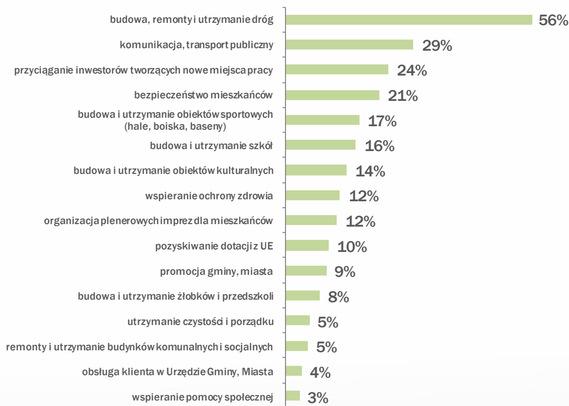
Wykres 4. Priorytety inwestycyjne na obszarze PTO

Badani mieszkańcy obszaru PTO wskazywali dziedziny, na które władze ich gmin powinny przeznaczać najwięcej środków finansowych. Respondenci mogli wymienić maksymalnie 3 priorytety inwestycyjne. Budowę i utrzymanie obiektów sportowych wskazało 17 proc. ankietowanych, odpowiedź ta znalazła się na 5. miejscu. Powyższy pogląd najczęściej podzielają osoby w wieku 30-39 lat (22 proc.), natomiast najrzadziej – osoby w wieku 60 lub więcej lat (12 proc.). O potrzebie inwestowania w infrastrukturę sportową w większym stopniu przekonani są mieszkańcy miast (18 proc.) w porównaniu do osób zamieszkujących na obszarach wiejskich (13 proc.). Opinia ta jest szczególnie